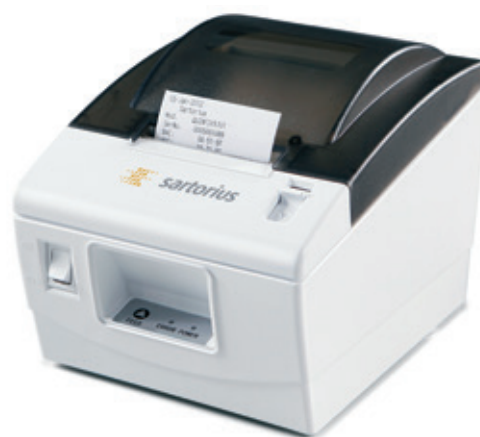
Plug & Play Impresora estándar YPD40

Dos grandes patas de regulación de fácil manejo y un nivel de burbuja perfectamente visible situado en la parte delantera facilitan la nivelación de la balanza y contribuyen a obtener resultados de pesaje seguros y reproducibles.