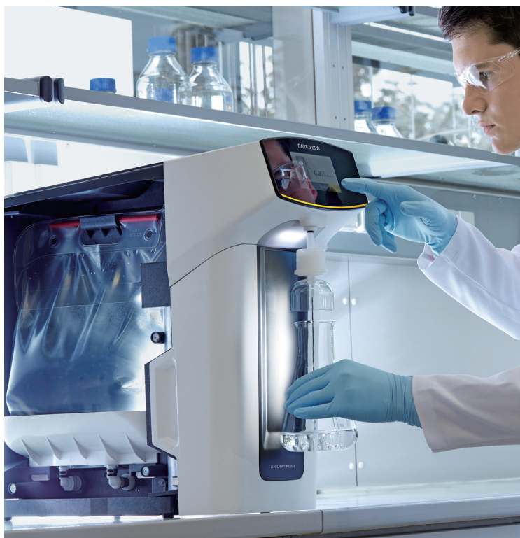
アリウム Mini の画期的な内蔵バッグタンク (側面カバーを外した写真)

超純水製造装置のバリデーション作業を弊社認定技術者がサポート致します。製薬業界では超純水装置に対して納入時や定期的なバリデーションが必要とされています。それらに対応するために、グローバルで共通のドキュメントに沿って据付時適格性検証 (IQ)、稼働時適格性検証 (OQ) を実施します。