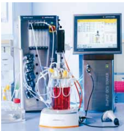
Abb. 2: Der Univessel SU ist ein neuer Einweg-Rührbioreaktor, der speziell für die Prozessentwicklung konzipiert wurde.

Der Univessel SU kann bereits heute flexibel an bestehende Bioreaktor-Kontrolleinheiten angeschlossen werden. Weitere Kulturgefäßkomponenten wie ein Abluftkühler, andere Rührergeometrien, etc. sind in der Entwicklung, die künftig auch mikrobielle hochzelldichte Kultivierungen mit instrumentierten Einwegkulturgefäßen erlauben. Darüber hinaus wird die Produktfamilie Univessel SU durch weitere Gefäßgrößen ergänzt. ●